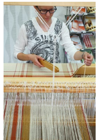
2. Kutoja vetää loimilangan pois niidistä ja pirrasta ja heit- tää kuteeksi.