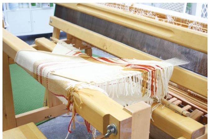
3. Loimilangat katkaistaan niistä järjestyksen mukaisesti ja heitetään kuteeksi. Reunaan jäävät hapsut solmitaan aika ajoin kevyellä solmulla kiinni, jotta reunasta tulee tasainen.