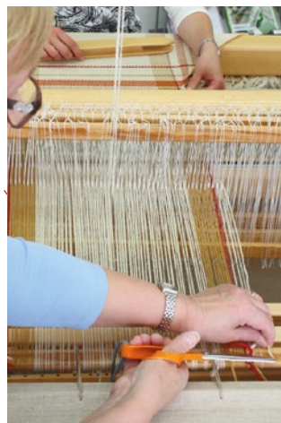
1. Avustaja katkaisee loimi- langan.